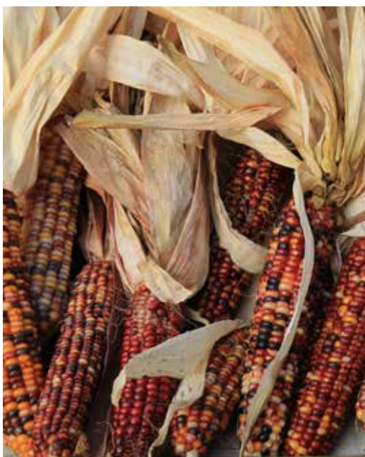
Mazorcas de diversos colores, plantas autóctonas de América Latina