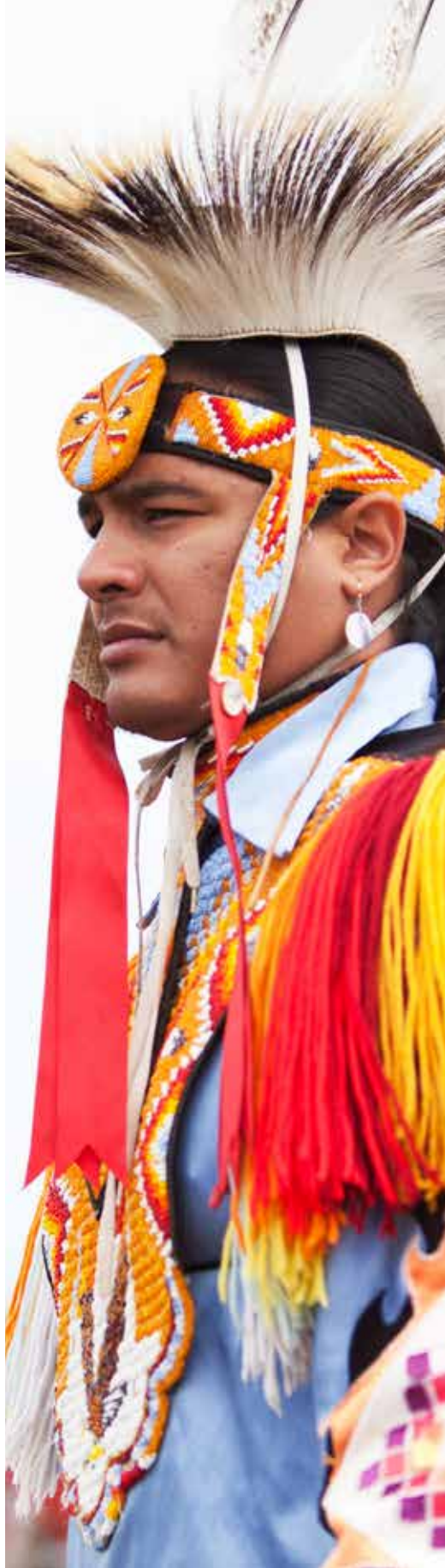
Nativo americano, Estados Unidos de América