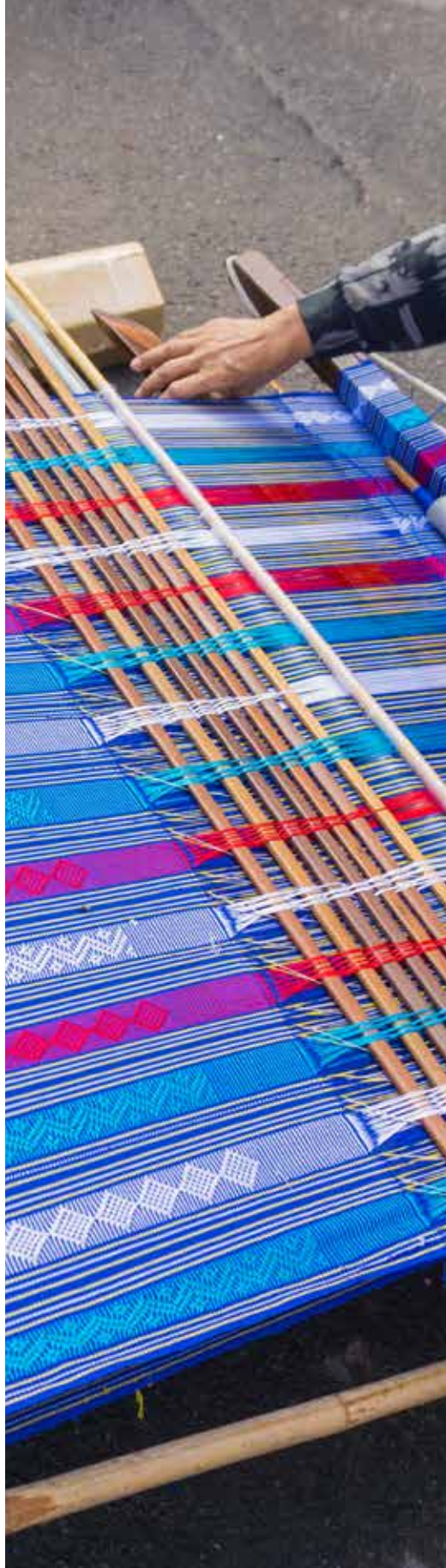
Telar artesanal, Vietnam