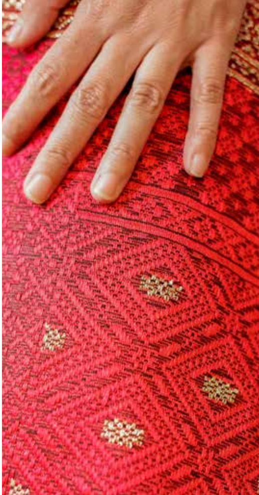
Textiles utilizados por las comunidades karo, Indonesia