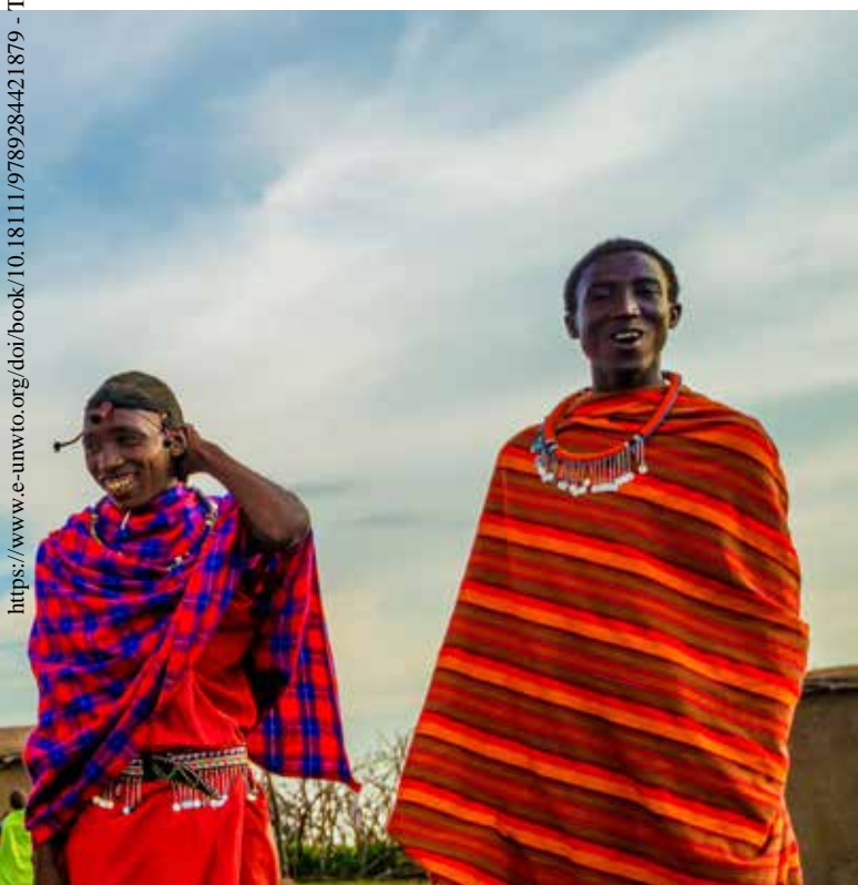
Comunidad masái, Kenya