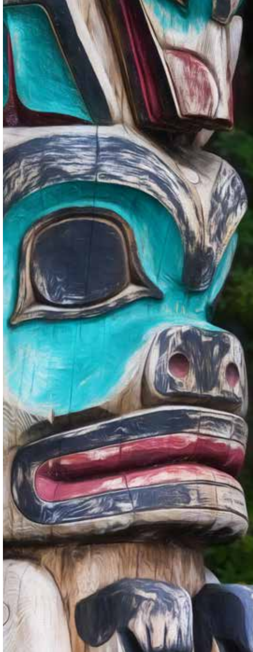
Tótem en Sitka, Estados Unidos de América