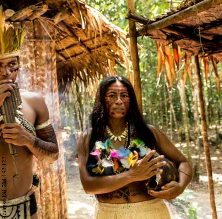
Tribu indígena en la Amazonia, Brasil